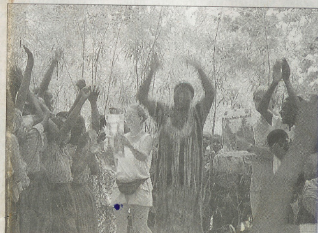
Groß war die Freude über die Nachricht, dass es im November in Malanga einen Marathon geben wird.

Nähere Informationen zur Reise gibt es im Internet unter www.kenia-jambomarathon.com oder www.kenia-kinderhilfe.de .